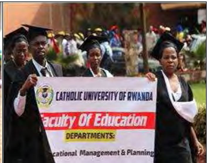
... de même que l'Université catholique du Rwanda.