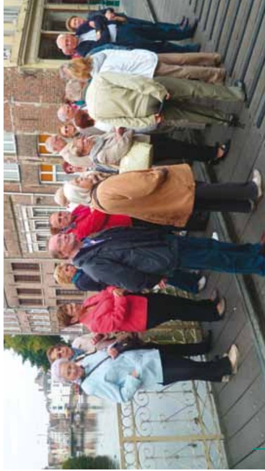
Culture néerlandaise : excursion à Gand Nederlandse Cultuur : uitstap naar Gent (15/09/12)