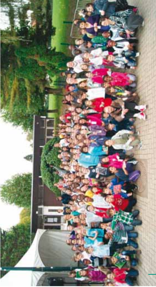
Jeunesse francophone : « Place aux Enfants » Franstalige jeugd : « Place aux Enfants » (21/10/12)