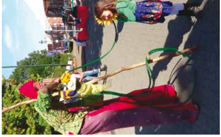
Culture française : Fêtes du 27 septembre Franse Cultuur: Feest van de Franstalige Gemeenschap van 27 september (30/09/12)