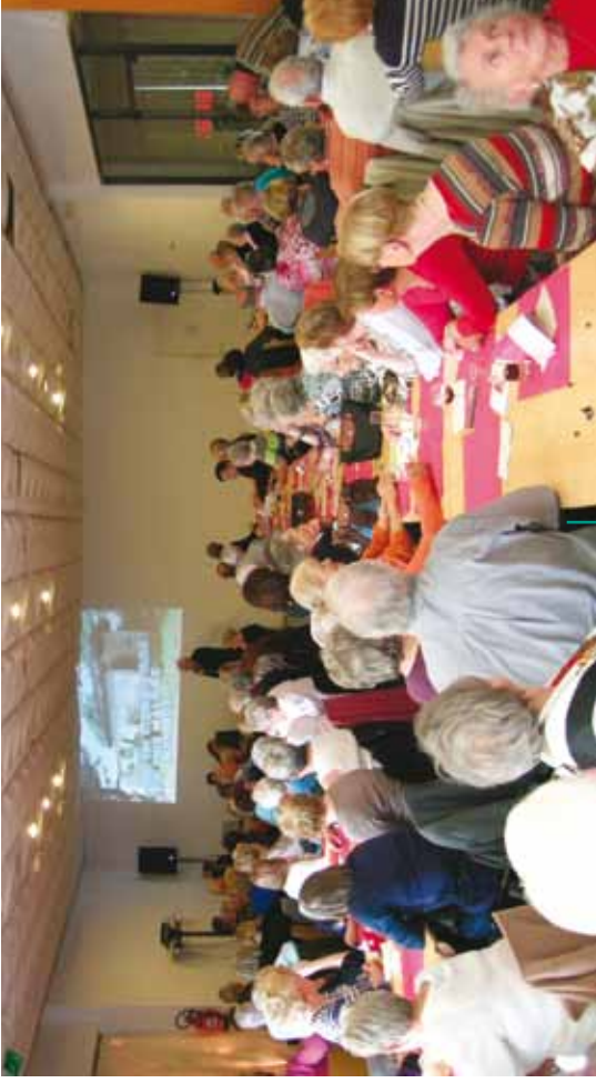
Troisième Age : Karaoké des Seniors Derde Leeftijd : Seniorenkaraoke (9/10/12)